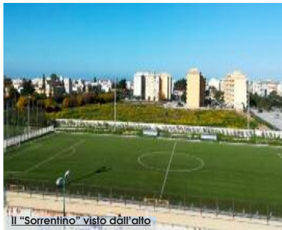
Il "Sorrentino" visto dall'alto

Due sono state le società calcistiche che hanno preso parte alla gara d'appalto, fornendo le proprie offerte: il Trapani Calcio e l'Accademia Sport Trapani. Il Trapani