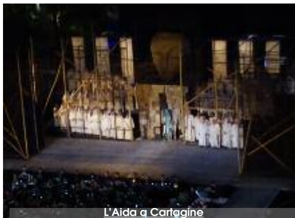
L'Aida a Cartagine

sono venute dal sindaco Tranchida, che aveva inviato un video-messaggio, molto apprezzato, per la conferenza stampa di presentazione dell'Aida il 25 giugno scorso alla Cité de la Culture di Tunisi. Ma è pure nota, come più volte ripetuto in campagna elettorale dallo stesso, la posizione della nuova Amministrazione che ha il proposito di istituire una nuova fondazione che riesca a gestire tutta la proposta culturale, dove il Luglio ne sarà solo una parte. Dovrà solo continuare a fare (e sempre così bene aggiungo io), ciò che istituzionalmente sa fare.