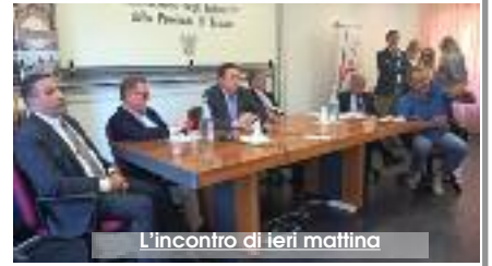
L'incontro di ieri mattina

"La conditio sine qua non - ha affermato Giambrone - è che Airgest torni ad essere una società senza tutti questi debiti. Non ci