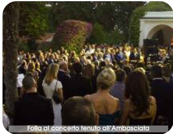
Folla al concerto tenuto all'Ambasciata