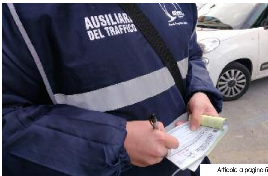
Articolo a pagina 5