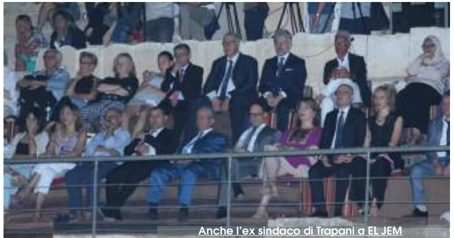
Anche l'ex sindaco di Trapani a EL JEM

Via alla stagione lirica e al Trapani Pop Festival 2